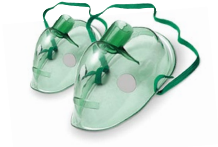
Маски: дитяча та доросла